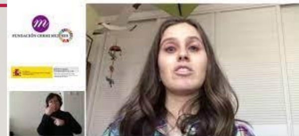
conocer unos días antes, pero bueno, pensando que iba a ir todo muy bien y que sin más, y nada más lejos de la realidad. Cuando llego a